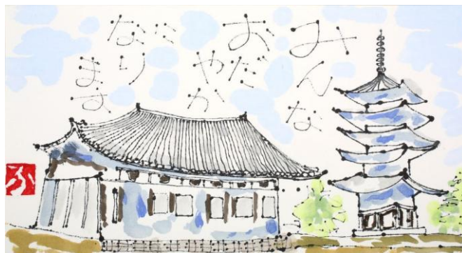
会長の自信作 "興福寺"