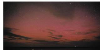
石川県珠洲市長橋町で撮影したオーロラとみられる現象。

また、一連の太陽フレアで最大の規模は5月15日に発生したX8.7であり、これは現在の太陽活動周期25が始まってから現在までに観測された最大規模の太陽フレアです。